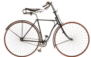
Sicherheitsniederrad, 1888 TECHNOSEUM, Klaus Luginsland