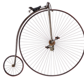
Hochrad, um 1885