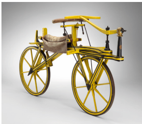
Laufmaschine nach Karl Drais, 1820 Nachbau

1877 wurde dann von einem Engländer namens John Kemp Starley das „Rover-Zweirad“, ein Niederrad mit Kettenantrieb, erfunden. Den Durchbruch als Fortbewegungsmittel für die Bevölkerung schaffte das Fahrrad in der ersten Hälfte des 20. Jahrhunderts. Die Anschaffung eines Fahrrades wurde nun finanziell leistbar.