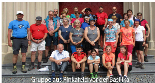
Gruppe aus Pinkafeld vor der Basilika

Auch dieses Jahr machte sich vom 8. bis 11. Juni eine Gruppe aus Pinkafeld nach Mariazell auf. Vom 20. bis 22. Juni war eine Gruppe aus Hochart auf den Weg in den Wallfahrtsort.