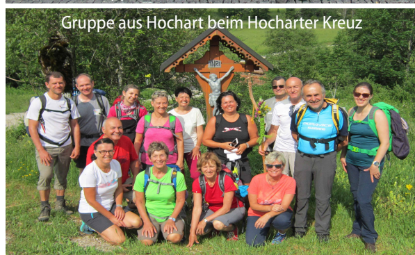
Gruppe aus Hochart beim Hocharter Kreuz

Neues Kreuz für die Wallfahrer aus Pinkafeld